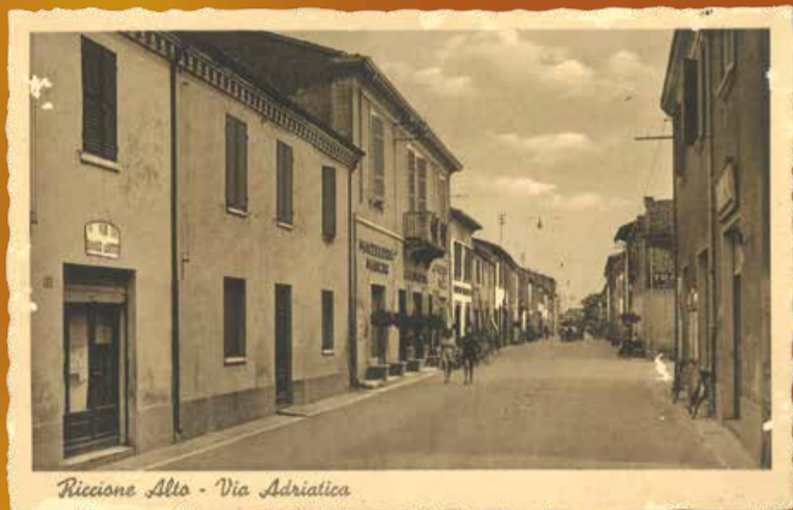
Riccione Alto - Via Adriatica