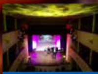
Videoproiezioni per ogni evento

nell'arte della Luce del Suono delle Immagini Informatica per lo spettacolo