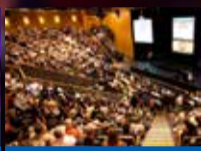
Service per congressi

Via Malpasso, 334 - S.Giovanni in Marignano (RN) Tel. 0541.957868